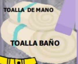
TOALLA DE MANO