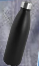
BOTELLA DE AGUA