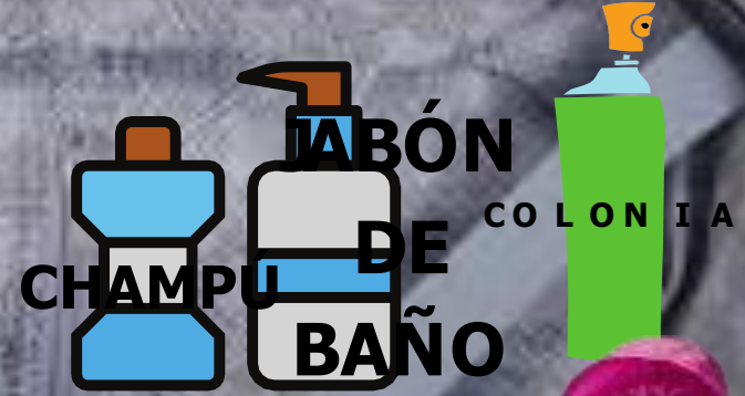
CHAMPÚ DE BAÑO