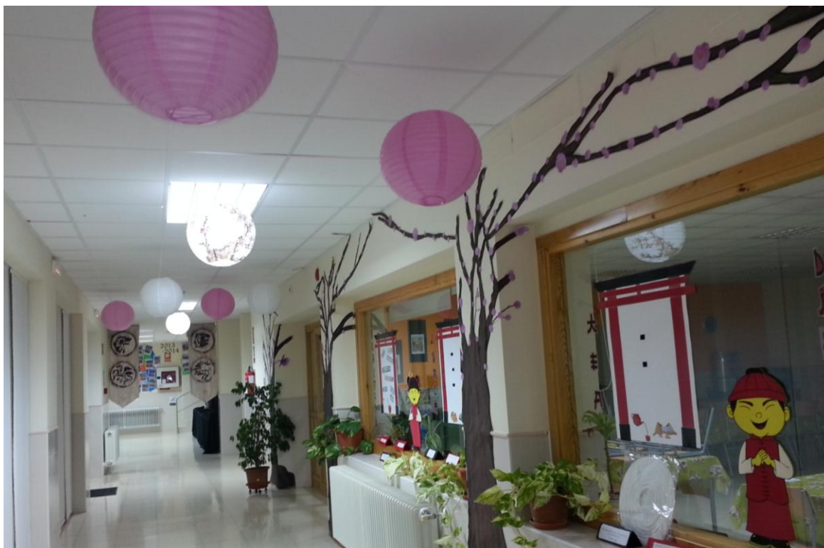
CENTRO RURAL DE INNOVACIÓN EDUCATIVA (C.R.I.E. DE ZAMORA)